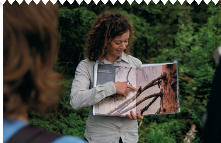
Bild: Mit einer Rangerin auf Tour

Und wer mehr über die Hintergründe erfahren möchte, findet in unserem Blog regelmäßig Einblicke in die Arbeit des Nationalparks und aktuelle Angebote: www.nationalpark-schwarzwald.de/nationalpark/blog